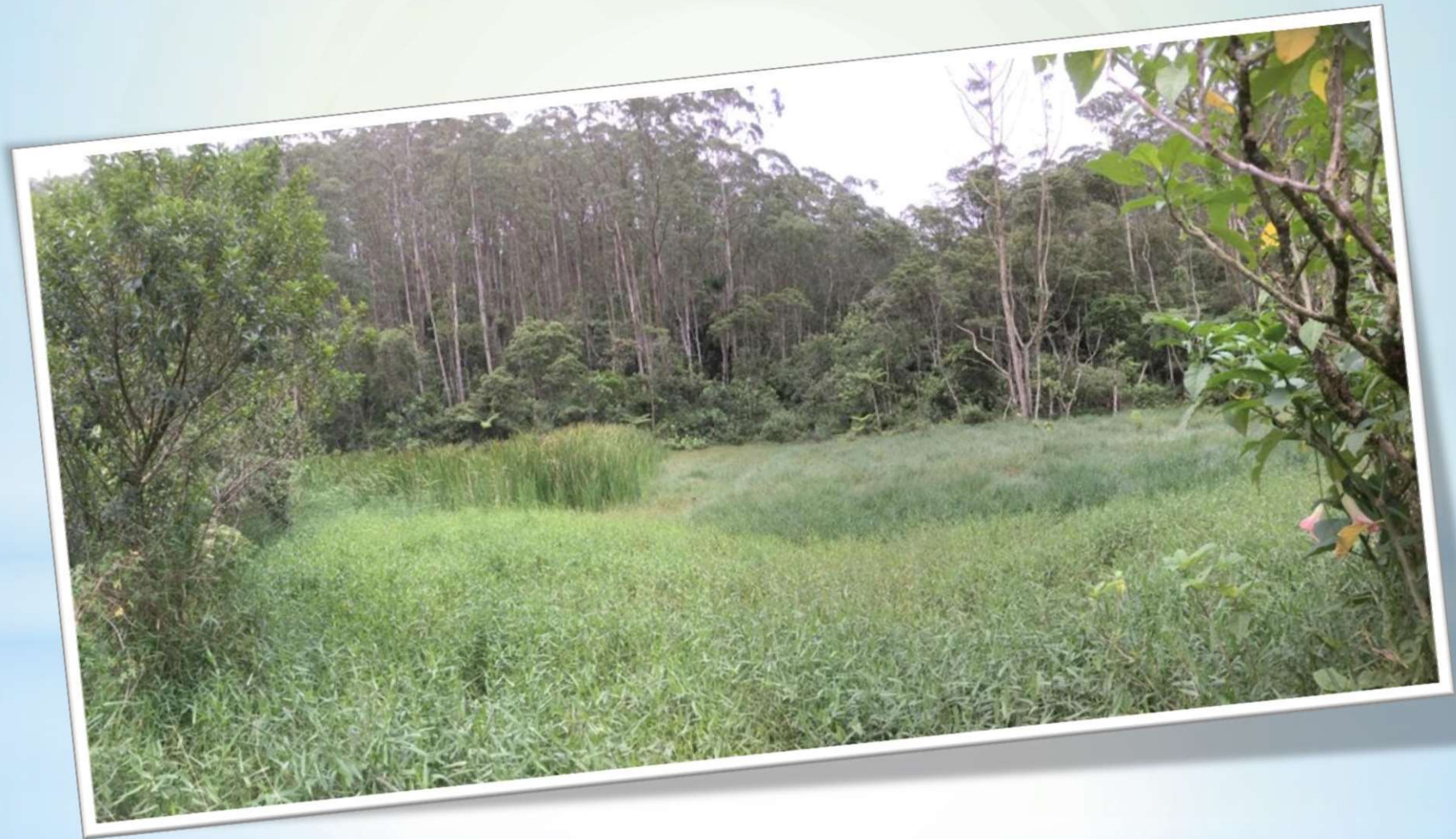
Ribeirão do Soldado