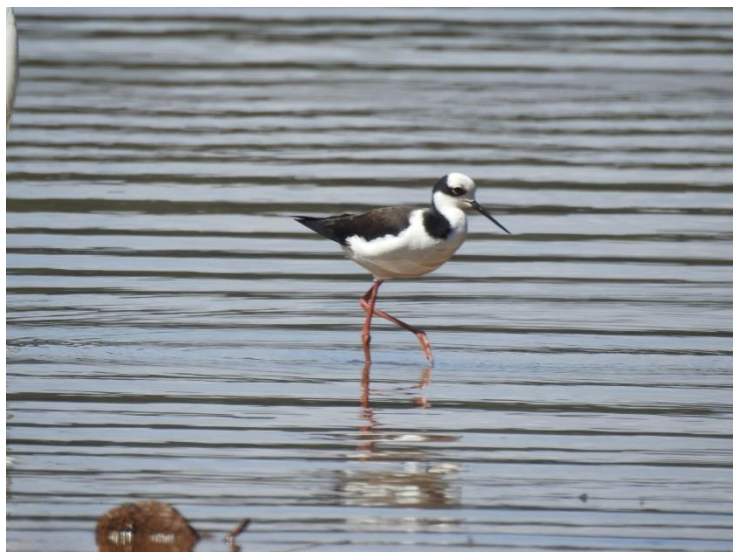
Pernilongo-de-costas-brancas ( Himantopus melanurus ).