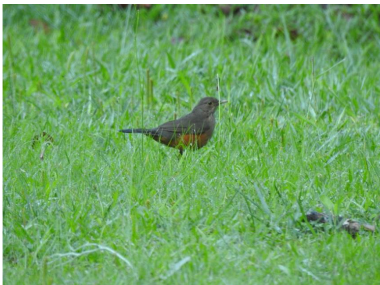
Sabiá-laranjeira ( Turdus rufiventris ).