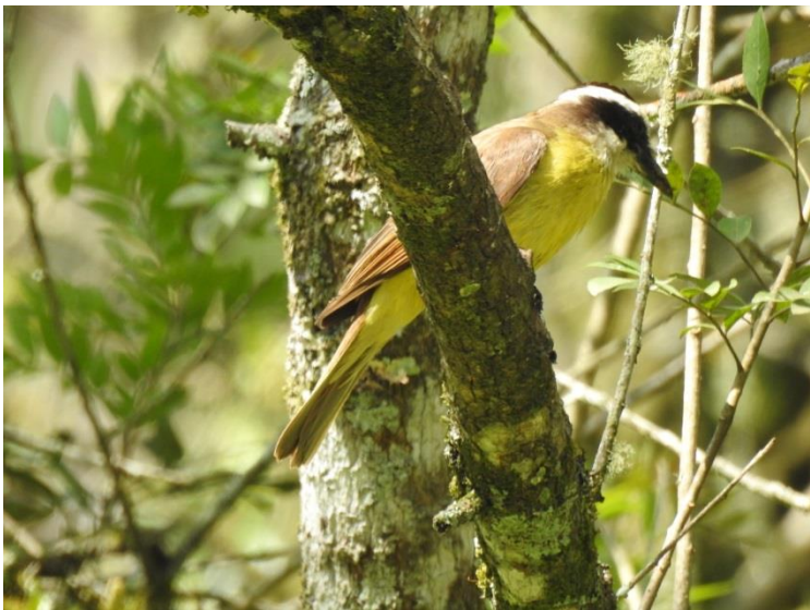
Bem-te-vi ( Pitangus sulphuratus ).