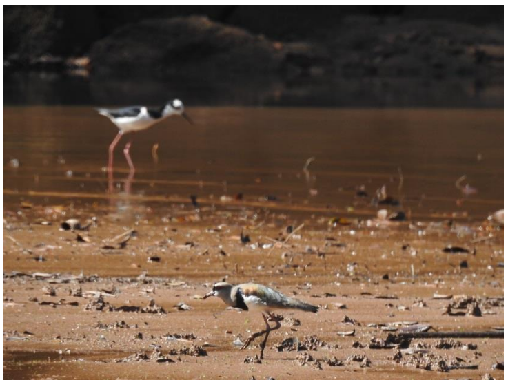
Quero-quero ( Vanellus chilensis ).