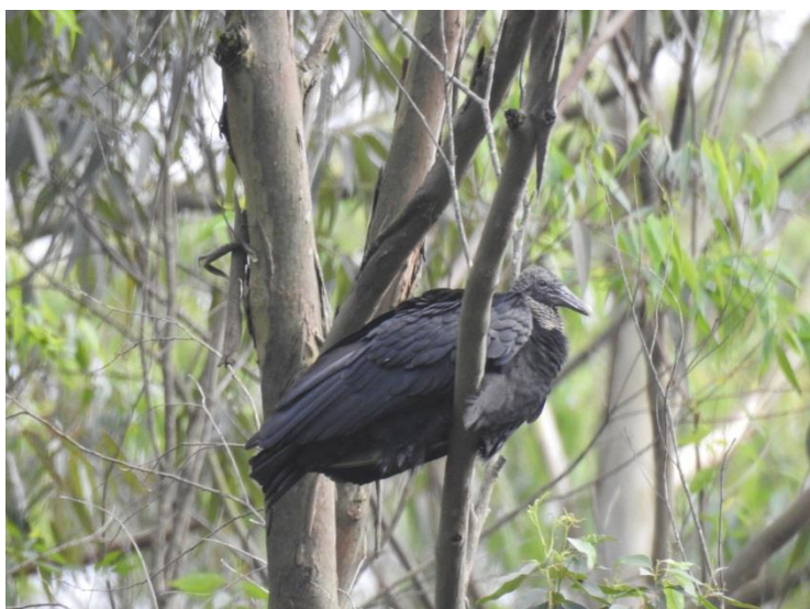
Urubu-preto ( Coragyps atratus ).