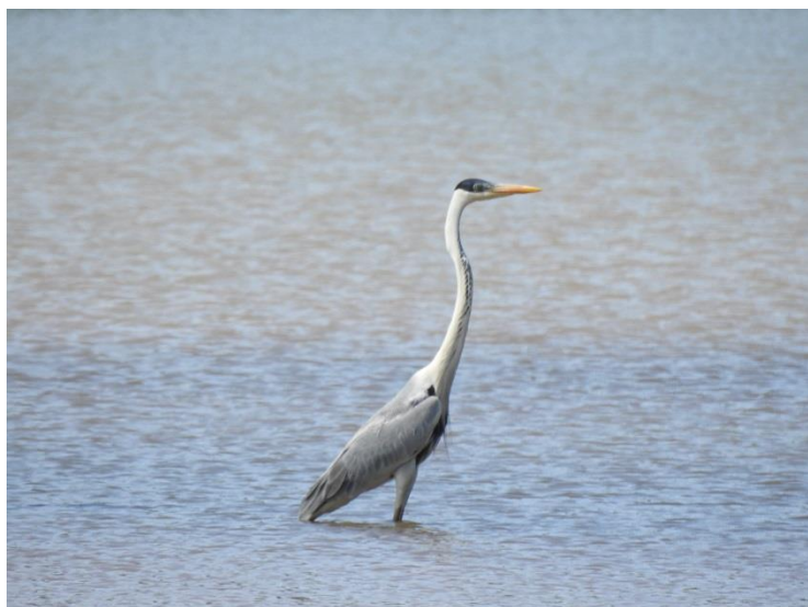
Garça-moura ( Ardea cocoi ).