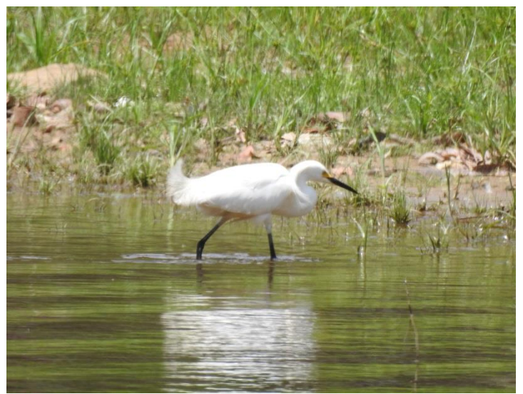
Garça-branca-pequena ( Egretta thula ).