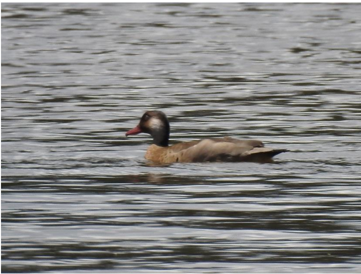
Marreca-ananái ( Amazonetta brasiliensis ).