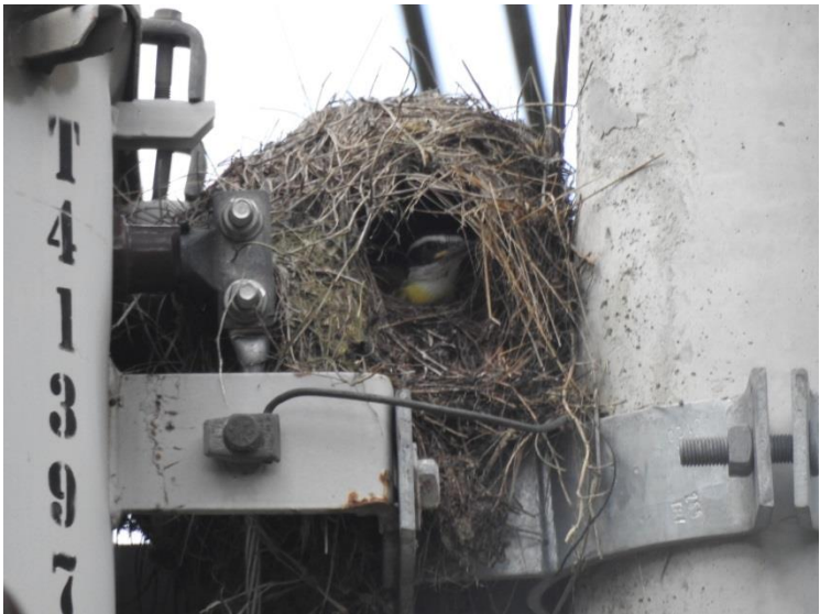
Ninho de bem-te-vi ( Pitangus sulphuratus ).