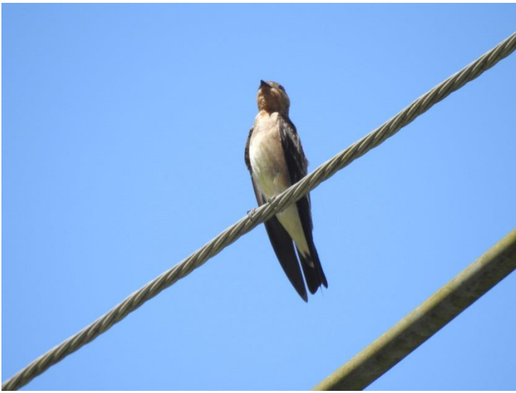
Andorinha-serradora ( Stelgidopteryx ruficollis ).