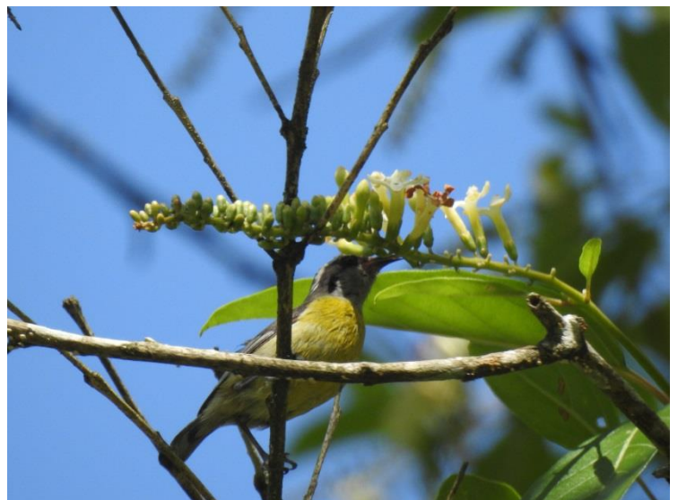
Cambacica ( Coereba flaveola ).