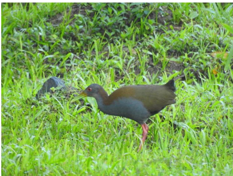
Saracura-do-mato ( Aramides saracura ).