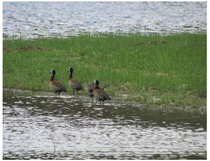
Ireré ( Dendrocygna viduata ).