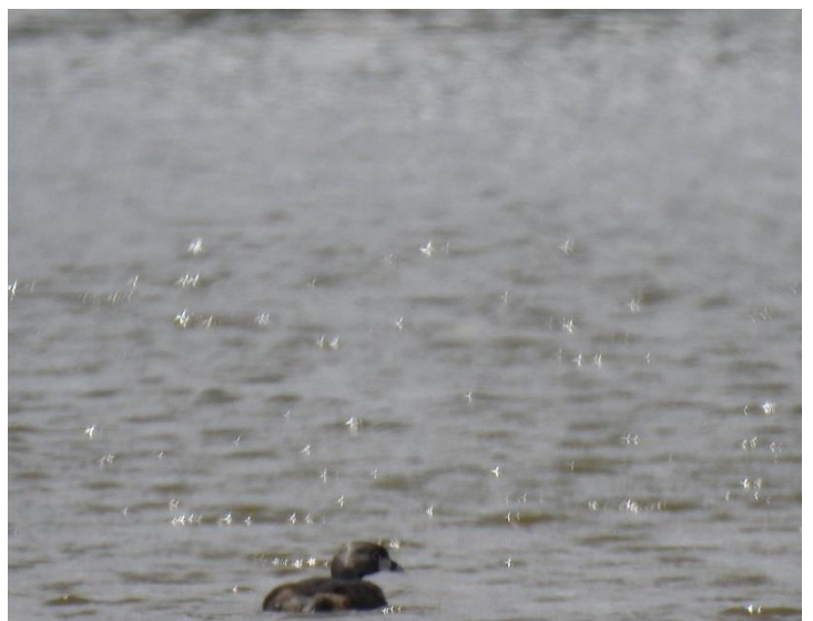
Mergulhão-caçador ( Podilymbus podiceps ).