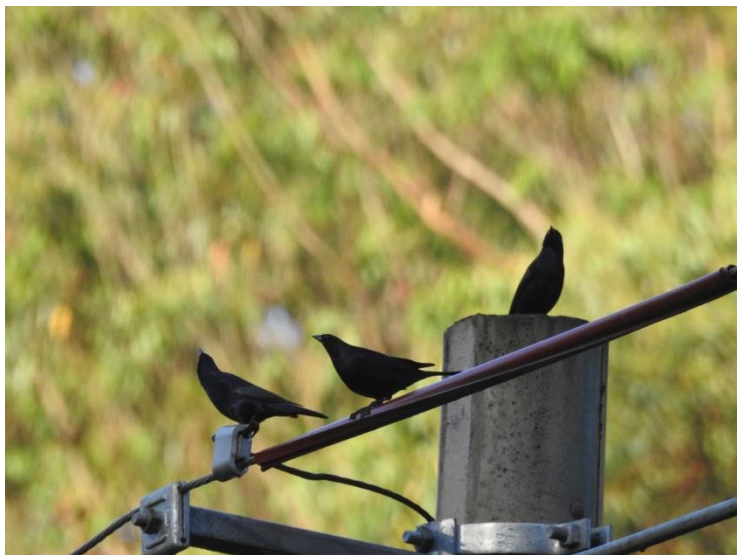
Chupim ( Molothrus bonariensis ).