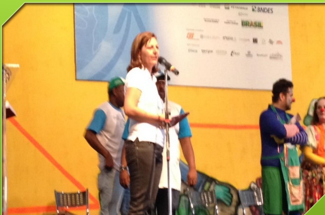
Expo Catadores Anhembi São Paulo