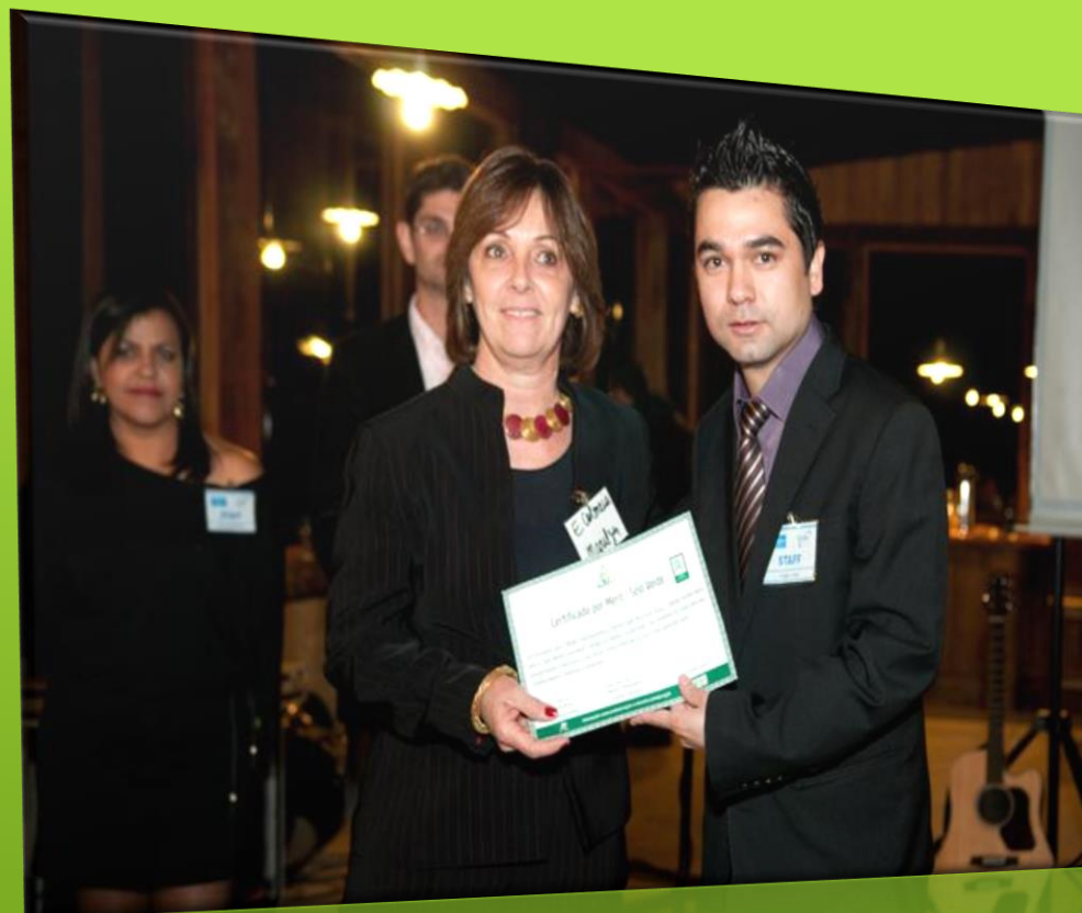
Expo Negócios São Paulo